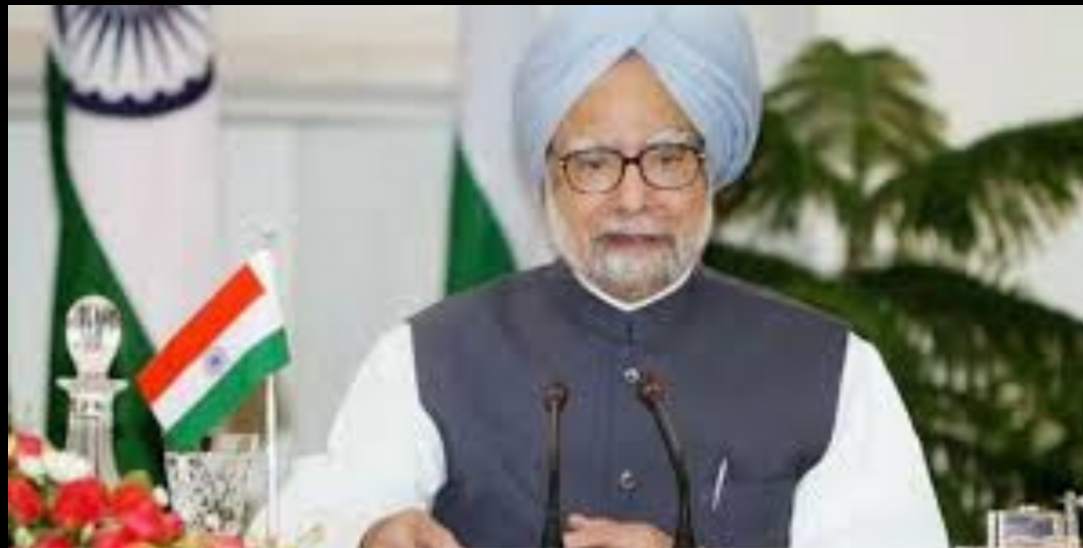
पूर्व प्रधानमंत्री मनमोहन सिंह 33 साल बाद आज राज्यसभा से रिटायर हुए।

Subscribe Kautilya Academy YouTube Channel