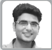
IRS UPSC - 2018 AMBUL SAMAIYA